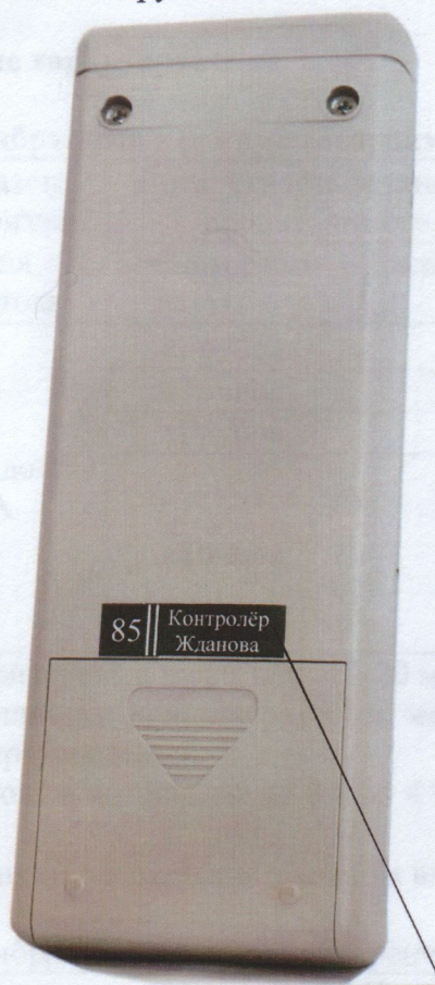
Пломба – наклейка

Для предотвращения несанкционированного доступа к внутренним частям приборов один из винтов крепления корпуса пломбуется.