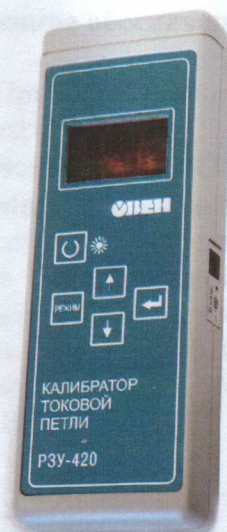
Рисунок 1 - Общий вид прибора

Фотографии общего вида приборов приведены на рисунках 1 и 2.